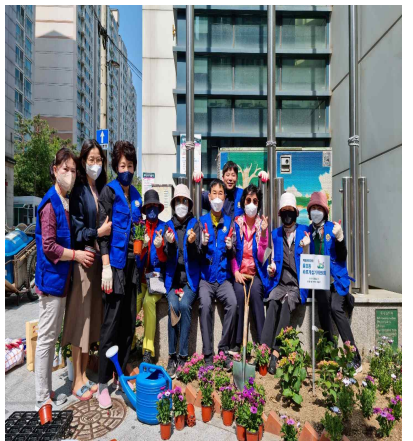
【무단투기 지역 화단 정비】