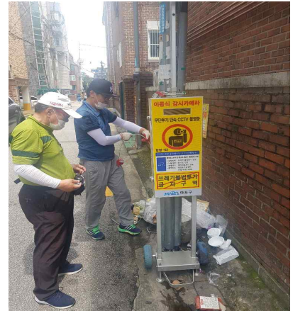
【이동형 CCTV 운영】