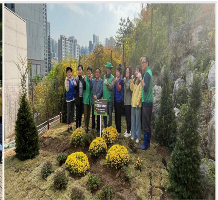
대흥이네 마을정원 조성사업