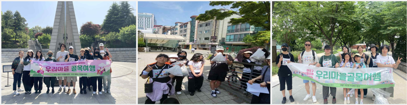
골목여행 프로젝트 사진