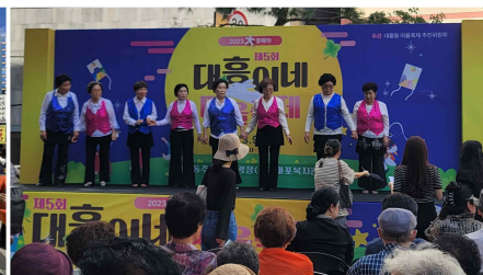
프로그램 수강생 공연