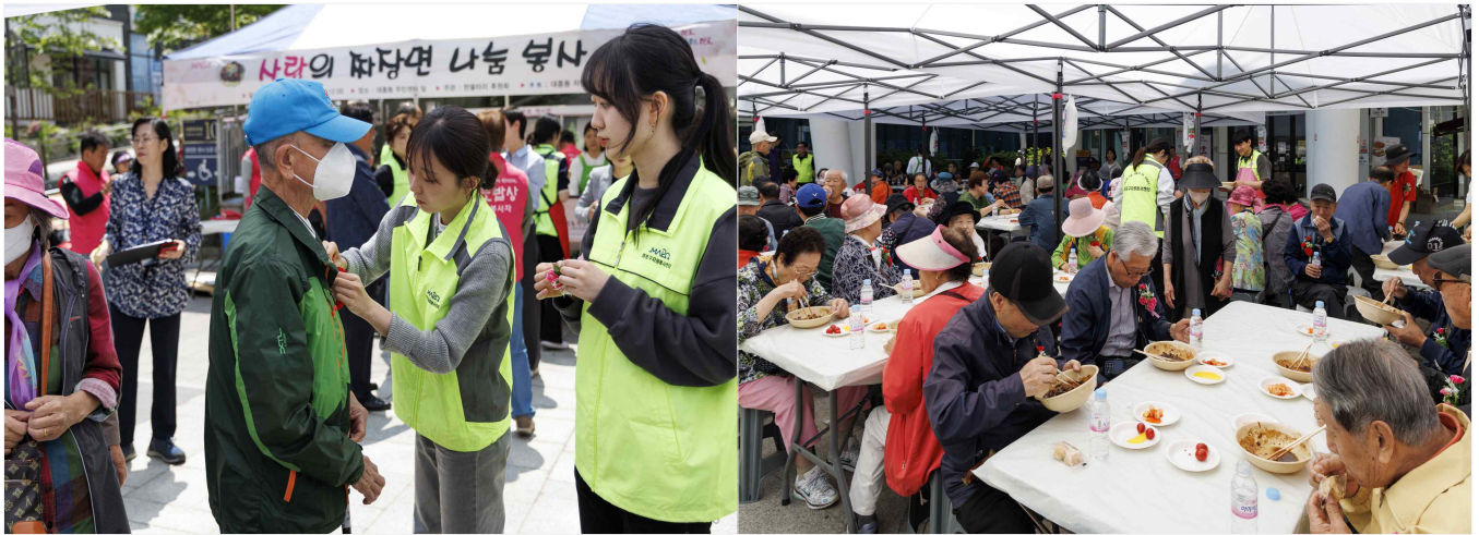
사랑의 짜장면 나눔 행사