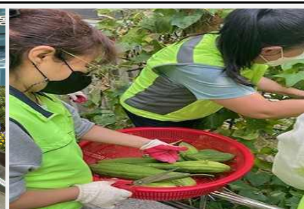
수세미 덩굴 만들기