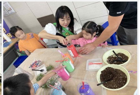
자원 재활용 교육