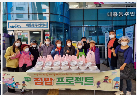
집밥 프로젝트 사진