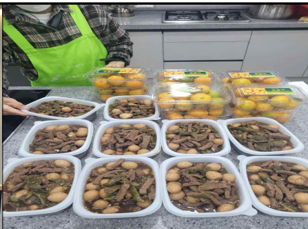
가을맞이 장조림 나눔