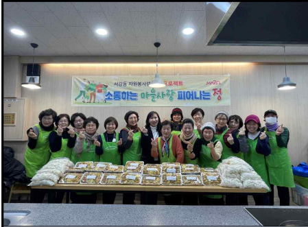
설맞이 음식 나눔