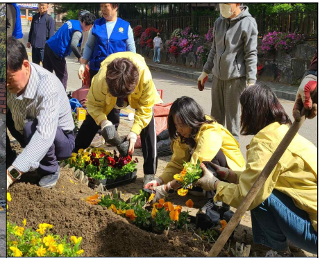
무단투기 근절을 위한 마을 꽃밭 조성