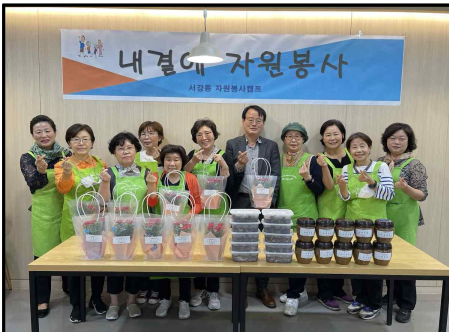
어버이날 기념 나눔