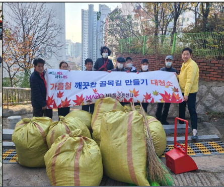
가을철 낙엽 청소 활동