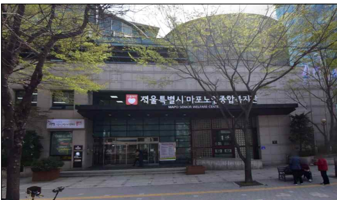
효도밥상 1호점 (시립마포노인종합복지관 1층)