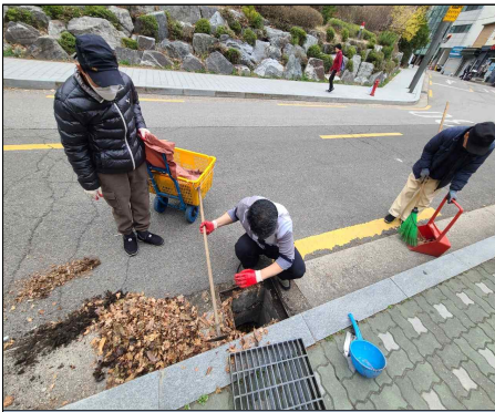
빗물받이 청소 활동