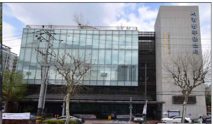
효도밥상 2호점 (서강동주민센터 2층)