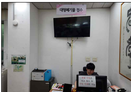
대형폐기물 접수창구 안내판