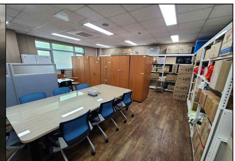
직원휴게실 및 물품 보관실 정비