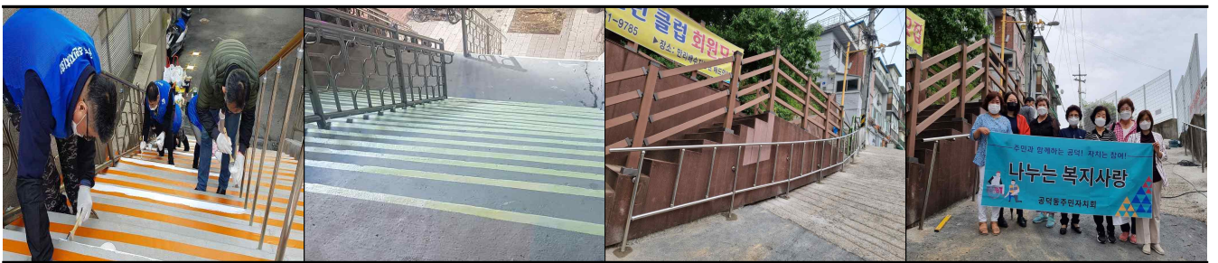
안전계단 조성(노후계단 형광페인트 작업)