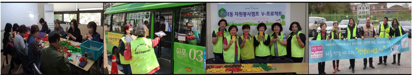
어버이날 카네이션 만들기