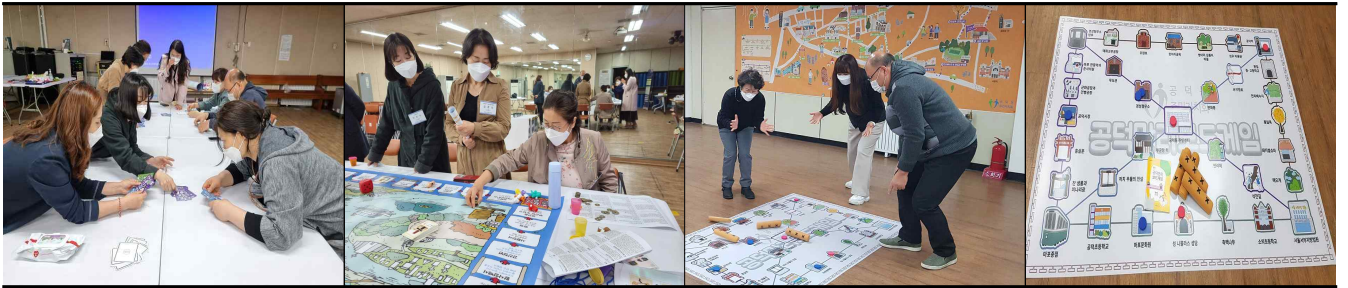
보드게임 제작 과정 모습