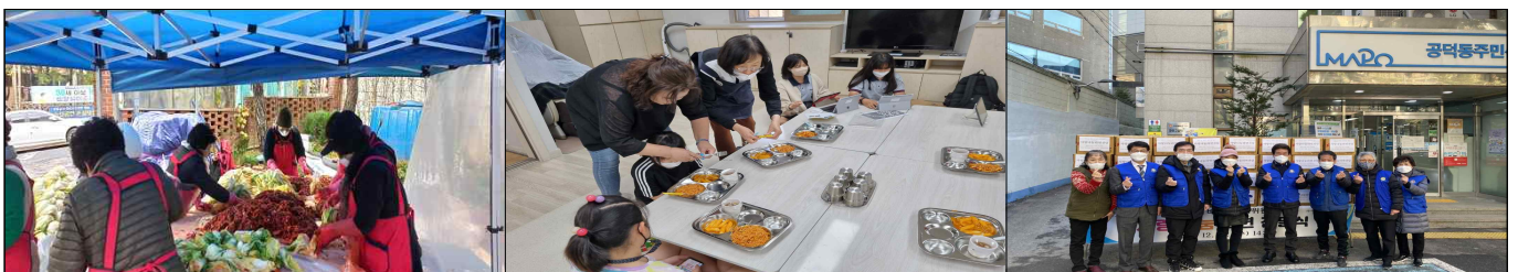
코로나19 거리두기 강화로 소외된 저소득계층에게 음식 전달